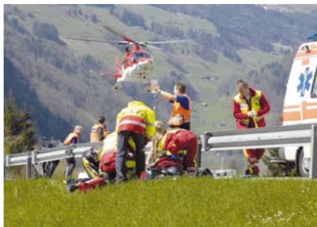
Jede Hilfe kam zu spät: ein Mensch starb nach der Kollision mit einem Leitplankenpfosten.

In immerhin drei Fragen herrscht Einigkeit unter den 9 Kantonen*, die an der Umfrage der IG Motorrad zum Unterfahrschutz an Leitschranken teilgenommen haben. Sie alle halten die Forderung nach einem solchen Schutz in gefährlichen Strassenabschnitten/Kurven für berechtigt. Mit einer Ausnahme sprechen sich auch alle dafür aus, das «System Leitschranke» grundsätzlich zu überdenken, keiner ist dafür, die Standardisierungsfrage für unwesentlich zu erklären und mit bisherigen «Lösungen» weiterzufahren. Einig sind sich die Kantonsingenieure zwar auch in Bezug auf den interkantonalen Erfahrungsaustausch; das jedoch mit negativen Vorzeichen: In keinem Kanton wird ein solcher Erfahrungsaustausch betrieben. Das verwundert indes auch kaum, denn nur fünf Kantone beschäftigen sich überhaupt mit dem Thema. Klein ist also auch die Zahl der Behörden, die mit einer solchen Infrastruktur schon Erfahrung