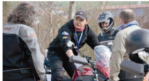
150 Mitgliedern offeriert die IGM die kostenlose Teilnahme an einem Bremskurs.

In brenzlichen Situationen gekonnt zu bremsen, ist noch immer eine der besten Überlebensversicherungen eines Bikers. Die IG Motorrad kämpft nicht nur für die Verbesserung der passiven Sicherheit ihrer Klientel in Form von Unterfahrschutz an Leitschranken oder durch die Sensibilisierung anderer Verkehrsteilnehmer, jetzt offeriert sie ihren Mitgliedern die kostenlose Teilnahme an einem Bremskurs mit Experten der Zürcher Motorradfahrerschule Mannhard. In kleinen Gruppen werden den Teilnehmern entscheidende theoretische Hinweise vermittelt, die dann umgesetzt und geübt